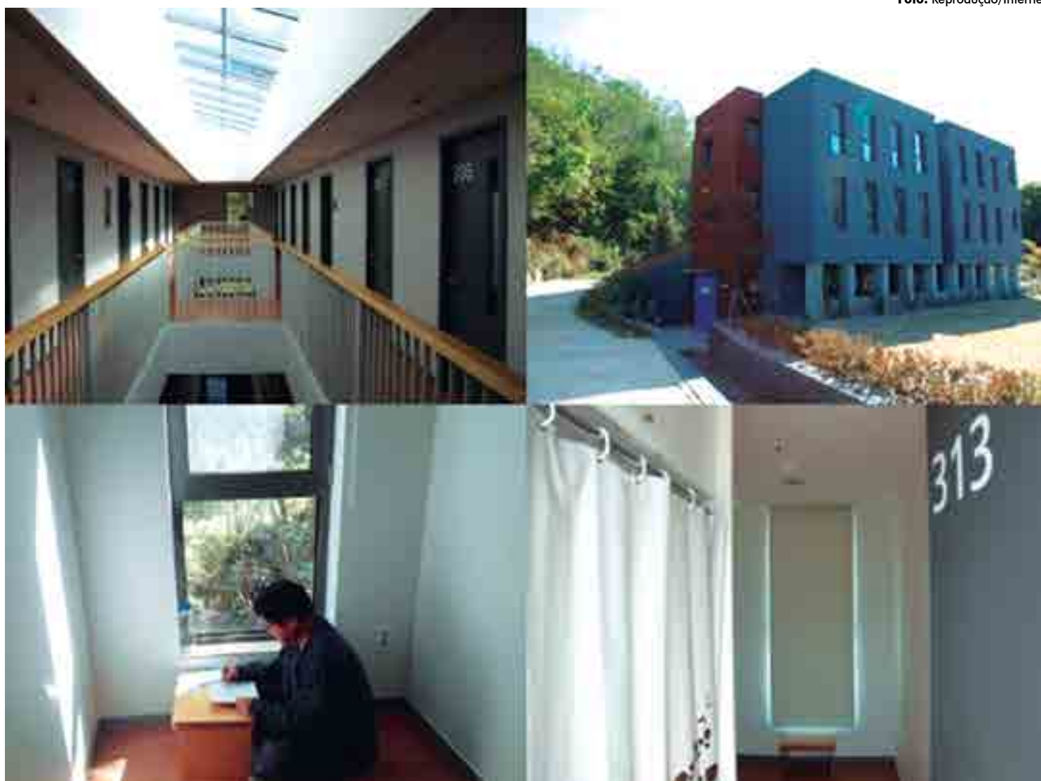
Os trabalhadores sul-coreanos pagam R$ 1.500 para ficar na cadeia, que tem celas pequenas e contam com poucas coisas como em uma prisão real

O centro é gerido por uma ONG chamada "Fábrica de Felicidade" e não tem a intenção de gerar lucros.