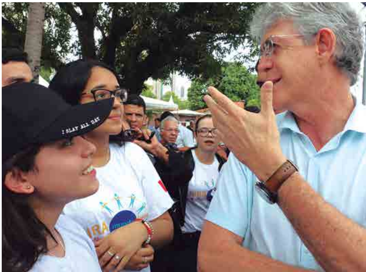
Na Granja Santana, governador Ricardo Coutinho conversou com os estudantes e destacou a oportunidade que eles têm de agregar conhecimentos

O coordenador do Gira Mundo, Tulhio Serrano, comentou que R$ 1,5 milhão foi investido nesta edição do Canadá e enfatizou que o programa está concretizando mais um ciclo de sucesso desta política pública de educação na Paraíba. "É uma satisfação muito grande ver a alegria desse grupo que fez um bom e proveitoso intercâmbio no Canadá. Esses meninos são a prova do êxito do Gira Mundo e eles vão agora motivar outros estudantes e a rede estadual como um todo", frisou.