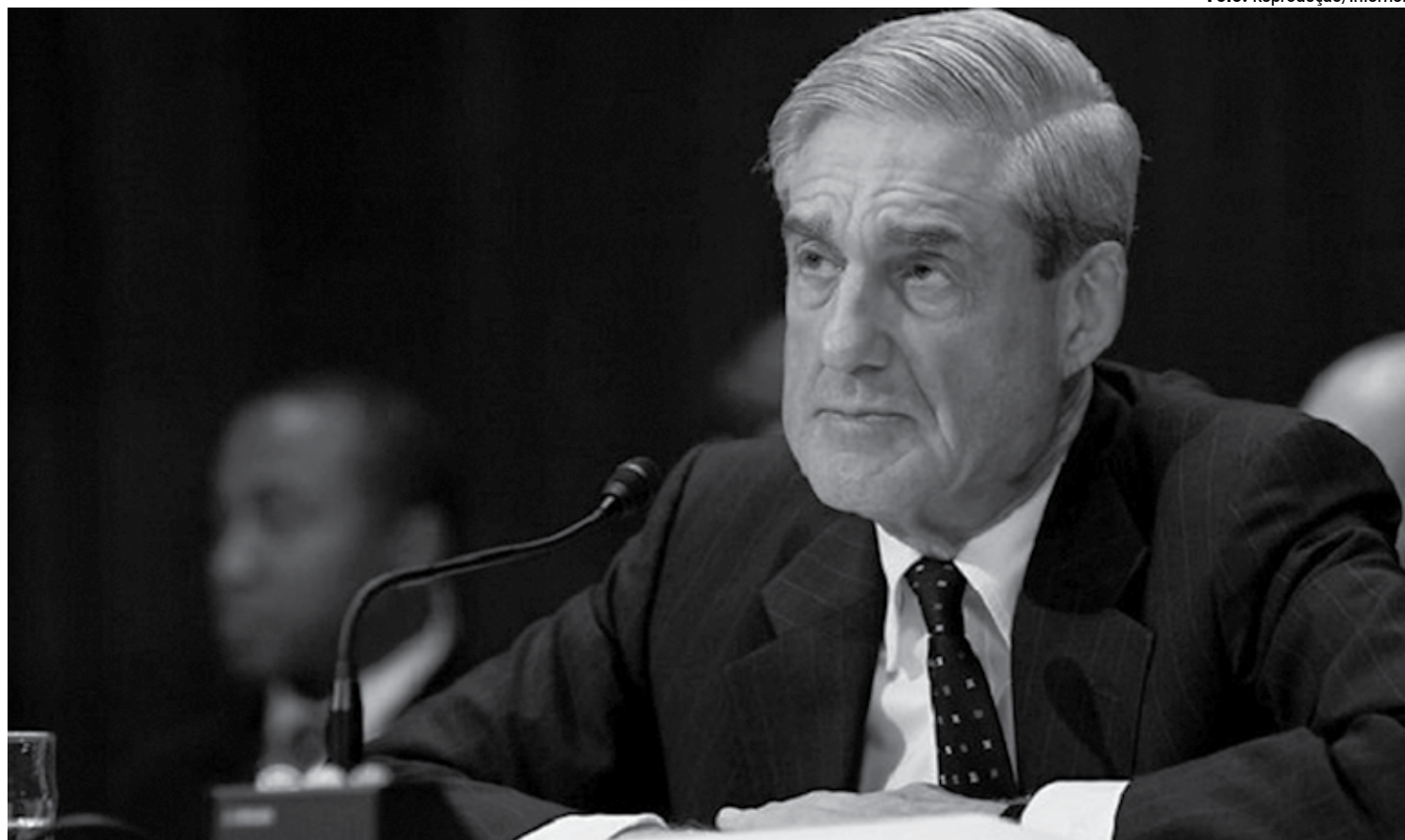
O procurador especial Robert Mueller alega que os membros do grupo se apresentavam como americanos e controlavam contas nas redes social

“Não há uma alegação nas acusações apresentadas (contra os cidadãos e empresas russos) de que a conduta tenha alterado o resultado da eleição de 2016”, afirmou Rosenstein em entrevista coletiva no