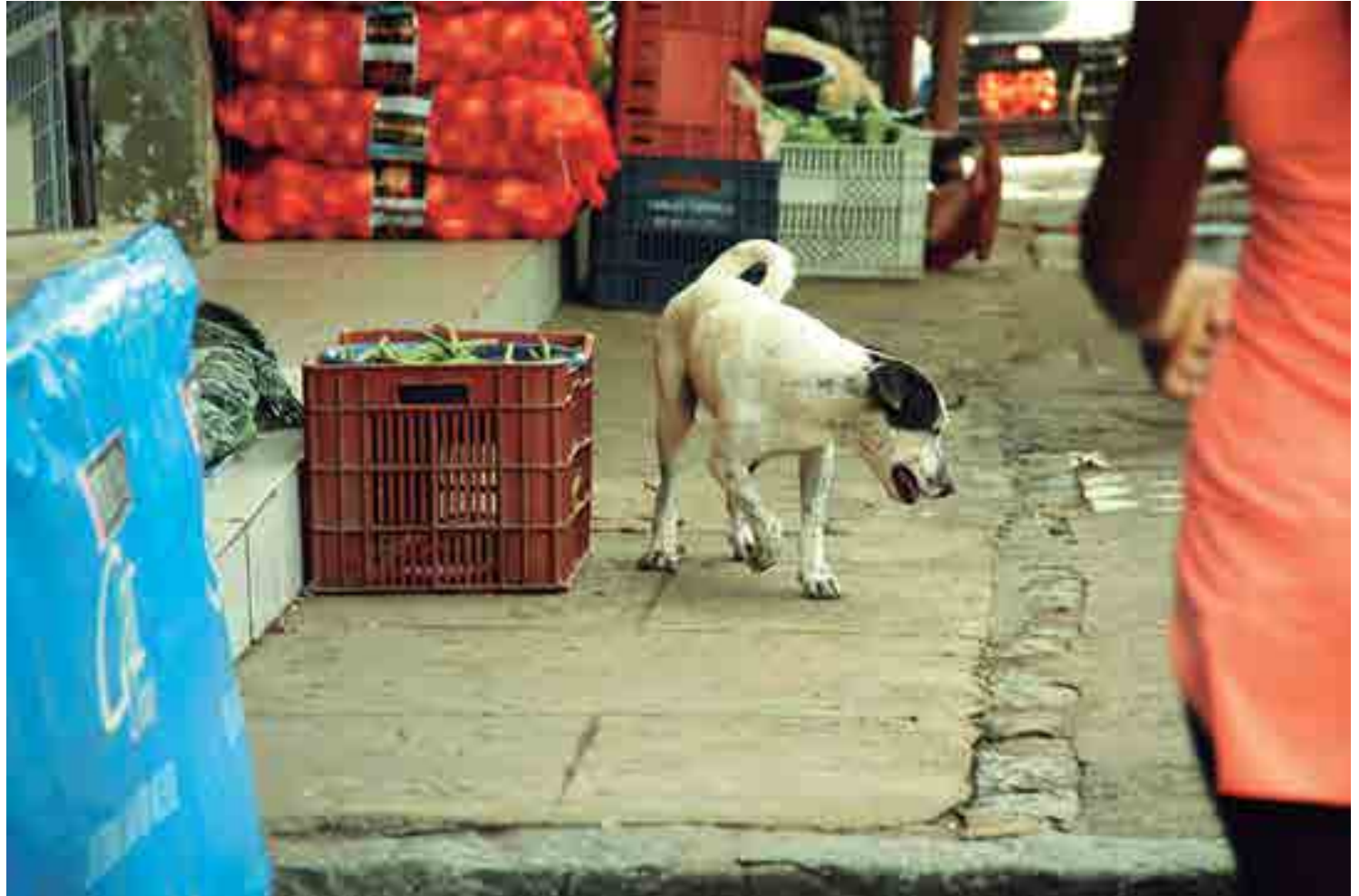
Transmissão da leishmaniose acontece quando o mosquito infectado pica cães sadios ou outros animais infectados e depois picam o homem

A transmissão da leishmaniose visceral acontece quando fêmeas de insetos flebotomíneos infectados (conhecidos como mosquito palha ou asa-dura) picam cães ou outros animais contaminados e depois picam o homem, levando o protozoário para a corrente sanguínea humana. No homem, a doença ataca vários órgãos internos, principalmente o fígado e o baço.