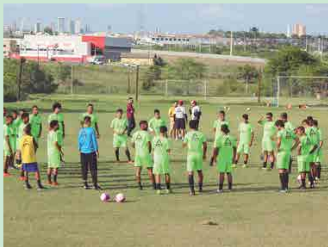
Jogadores do Serrano durante treinamento buscando forças para reagir no Campeonato Paraibano