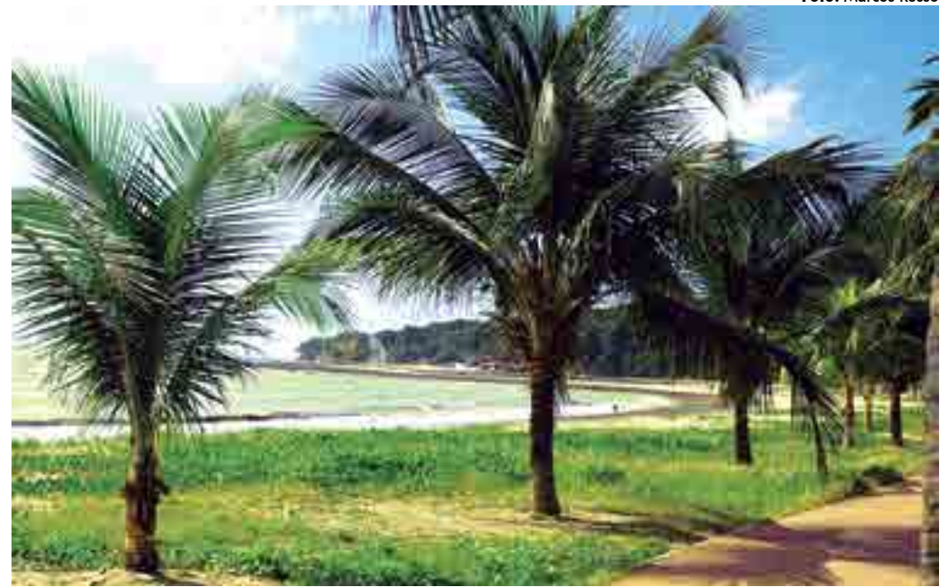
No Cabo Branco, está impróprio ao banho o trecho localizado no final da Rua Áurea, próximo à galeria pluvial

De acordo com o relatório semanal, em João Pessoa deve-se evitar a Praia do Besa I, na Avenida Presidente Afonso Pena, em frente ao estabelecimento comercial Sorveteria Friandise. Já na praia de Manaíra, a recomendação é não banhar-se no trecho em frente à quadra de Manaíra, na Avenida João Maurício. Na Praia do Cabo Branco, está impróprio ao banho o trecho localizado no final da Rua Áurea, próximo à desembocadura da galeria pluvial (100 m à direita e 100 m esquerda) e na rotatória do final da Av. Cabo Branco, evitar o banho 100 metros à direita e 100 metros à esquerda da desembocadura da galeria pluvial.