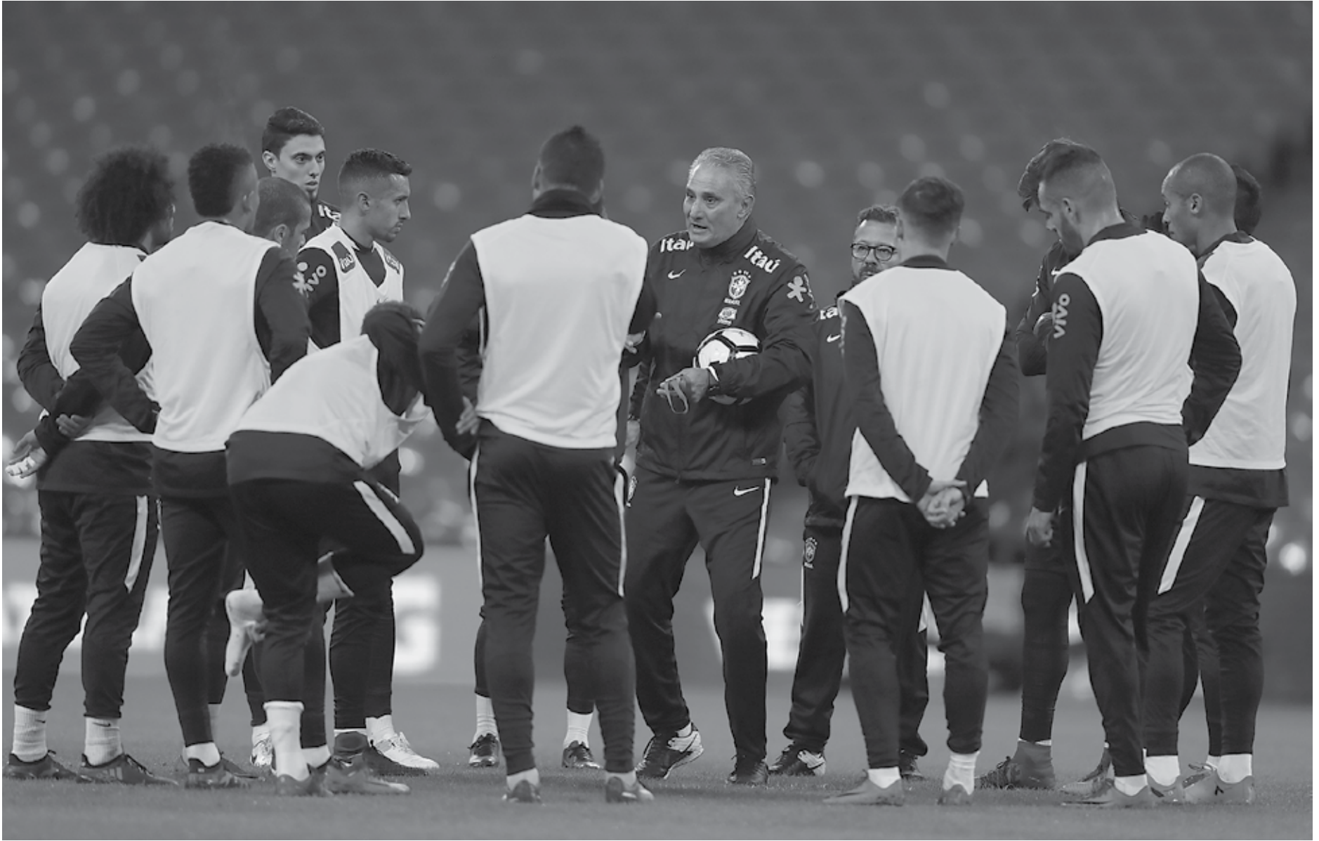
Mesmo com o elenco praticamente definido, Tite continua observando o desempenho de muitos jogadores que jogam fora do país, antes de fazer a convocação final para a Copa do Mundo da Rússia

É tradição que a seleção, quando campeã, vá a