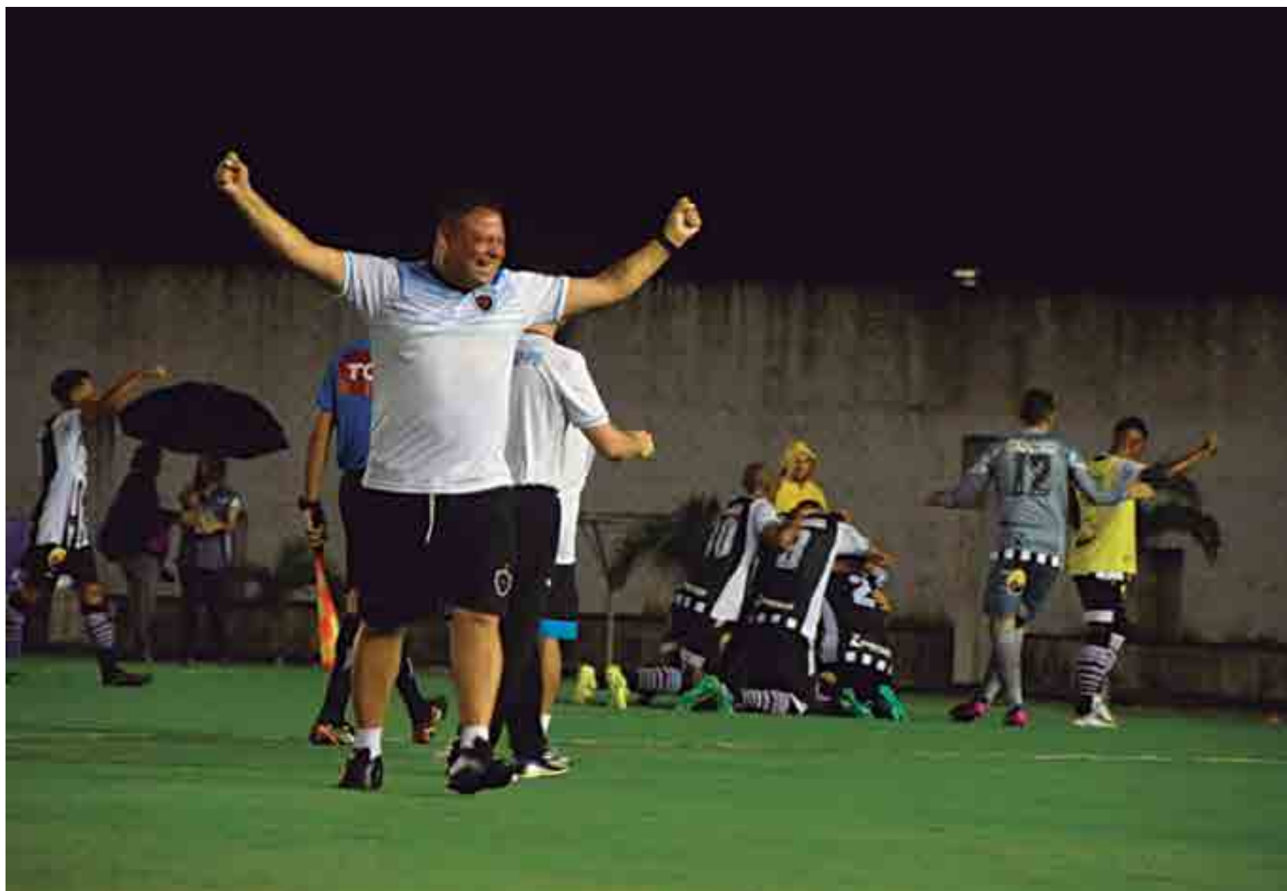
Gol de Dico e muita comemoração por parte da comissão técnica e jogadores; vitória por 1 a 0 sobre o Altos não só garantiu a liderança, como deixou a equipe praticamente classificada

"Sou um profissional do Botafogo e estava no banco torcendo pelos meus companheiros. Quando apa-