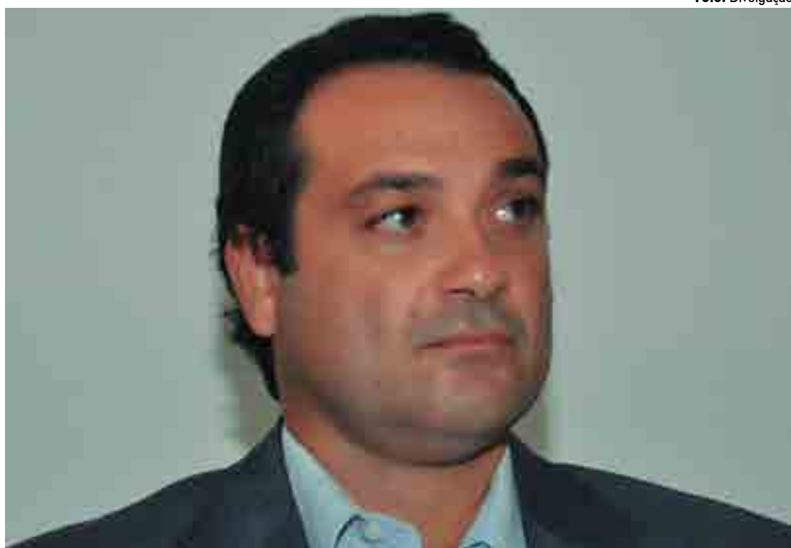
Rômulo é secretário de Estado do Desenvolvimento da Agropecuária e da Pesca e posse vai ser no dia 5 de março