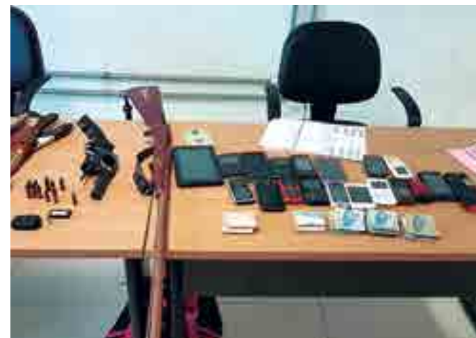
A PM apreendeu armas de fogo e recuperou vários produtos de furto