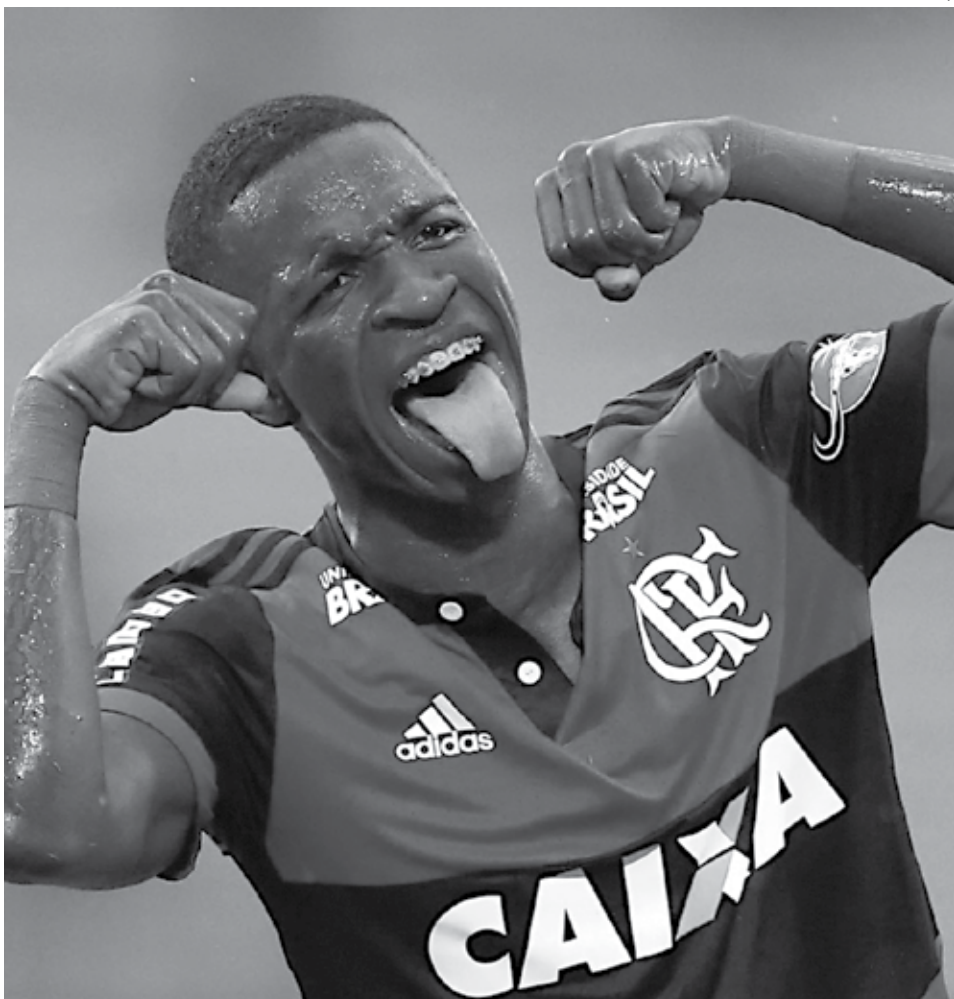
Tite não considerou uma ofensa a comemoração do gol de Vinicius Junior contra o Botafogo