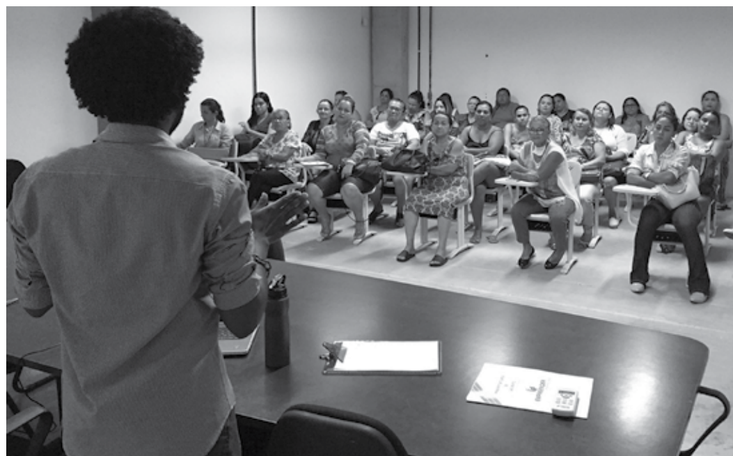
Empreendedores foram capacitados por meio de palestras ministradas por técnicos do programa

Cerca de 120 empreendedores foram capacitados por meio de palestras ministradas por técnicos do programa. Já na próxima etapa - a elaboração de plano de negócios - são identificados maiores detalhes de um empreendimento que se deseja iniciar ou ampliação de um já existente. Aproximadamente 40 pessoas foram atendidas e os mu-