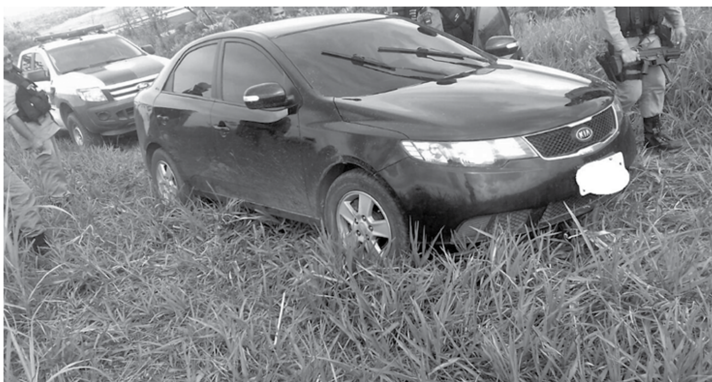
O carro e a espingarda de fabricação caseira estavam com quatro suspeitos que foram perseguidos pela polícia até o município de Rio Tinto