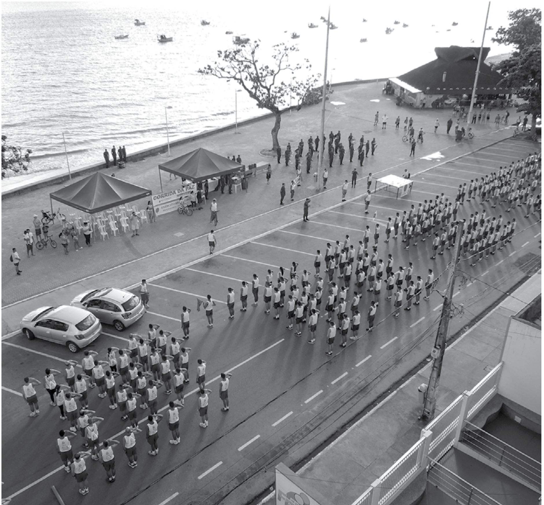
A largada da CISM Day Run será às 8 h15 da manhã em João Pessoa, com largada no Largo da Gameleira, na Praia de Manaíra, e com um percurso total de 4 quilômetros

Toda a sociedade paraibana está convidada a participar, não havendo, para tanto, necessidade de inscrição.