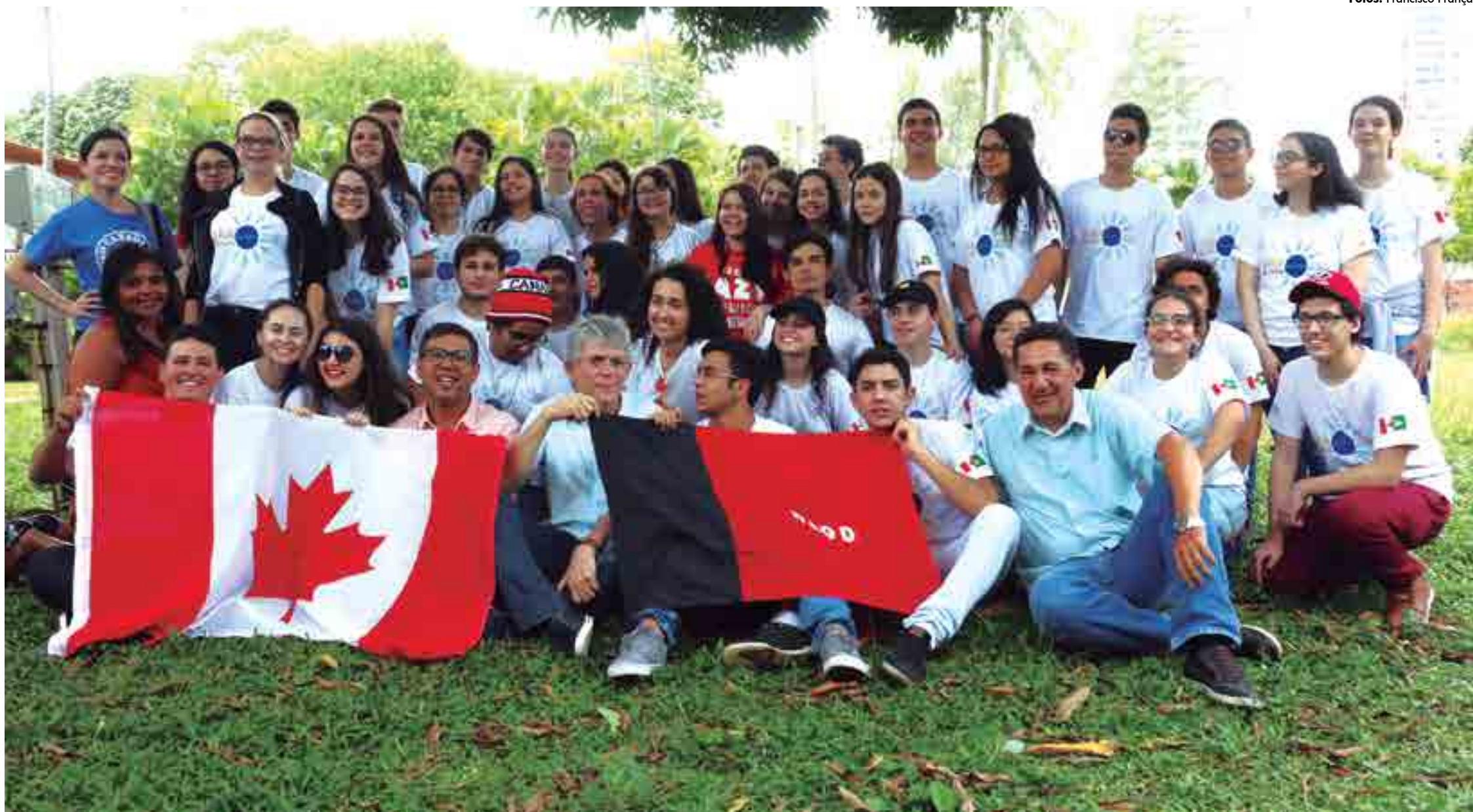
Estudantes da Rede Estadual de Ensino fizeram um intercâmbio de cinco meses e retornaram à Paraíba trazendo na bagagem conhecimentos sobre a cultura canadense e experiências que serão compartilhadas nas escolas